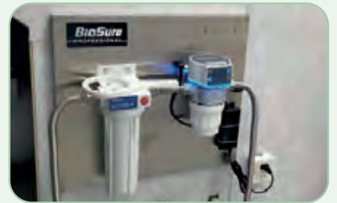
Vorbeugende Wartung von Wasserleitungen