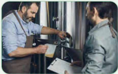
Brauerei und Weinkellerei