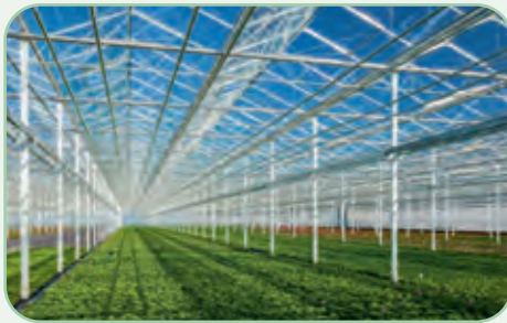
Landwirtschaft und Bewässerung