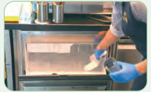
Eis und Getränke