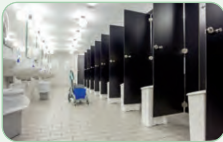
Raumhygiene und Geruchskontrolle